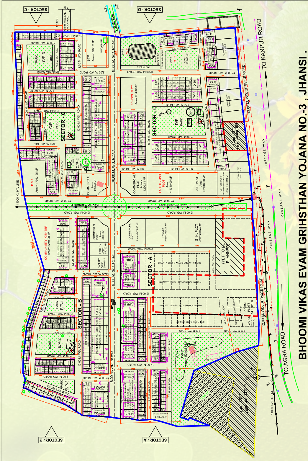
BHOOMI VIKAS EVAM GRIHSTHAN YOJANA NO.3, JHANSI.